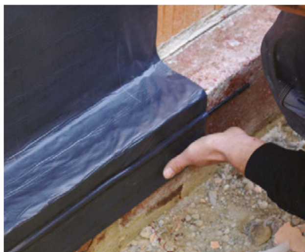
Abbildung 2: Montage der Bahn im unteren Abschluss