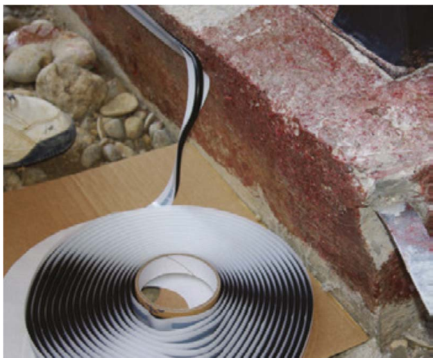
Abbildung 2: Montage der Wasserstop-Rundschnur "BTF RUNDSCHNUR"